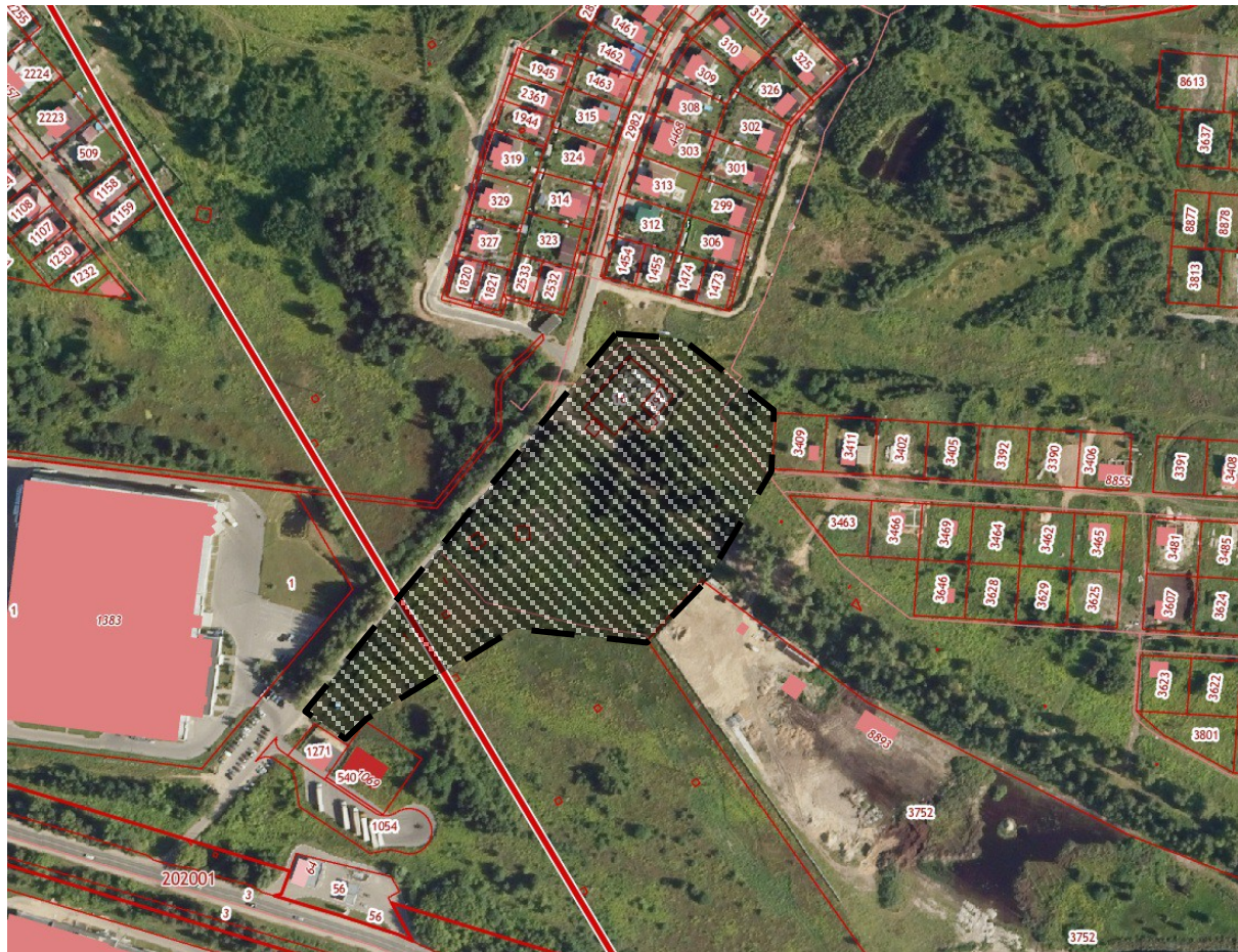
Схема границ территории